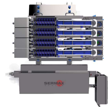
Vista en planta

La gama de pesadoras SERMAX® LMB "M" ha sido diseñada para efectuar dosificaciones hasta 0.70L, mejorando la higiene y seguridad dentro del entorno de pesaje y enfocada en productos adherentes y frágiles, manteniendo al mismo tiempo el alto nivel de precisión requerido. Las características clave incluyen: