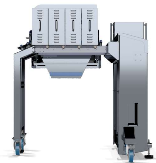
Vista posterior ( Diseño modular )