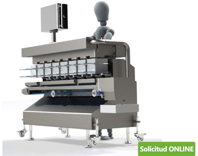
CLM vista de perspectiva ( versión de 8 líneas )